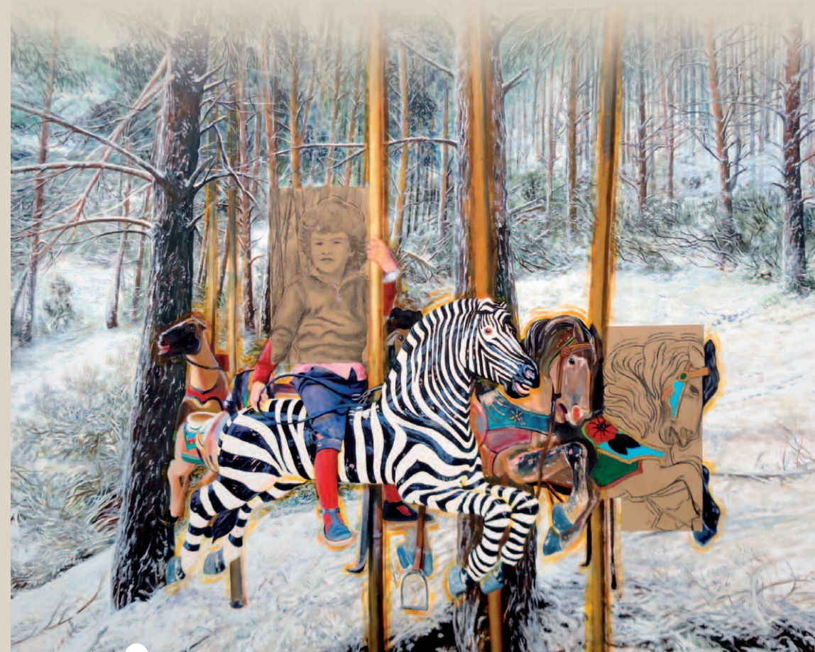
Foto portada: El sueño de mi hijo Moisés , 2009. Carbón sobre papel y óleo sobre lienzo. 190 x 233 cm