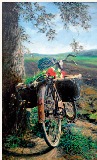
Flores para mamá , 2006 Óleo sobre lienzo. 130 x 81 cm