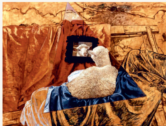
Triángulo de la curiosidad , 1993 Óleo sobre lienzo. 153 x 180 cm

Canadá, Inglaterra, Estados Unidos, Italia y Sudáfrica siempre ha guardado tiempo para visitar los museos y estudiar a otros artistas reflejando, como pocos en su obra, su respeto y admiración por el mundo artístico de épocas pasadas con reinterpretaciones de imágenes universales dentro de una personal técnica y estética. Como ejemplo de ello encontramos piezas como Baño en la alberca .