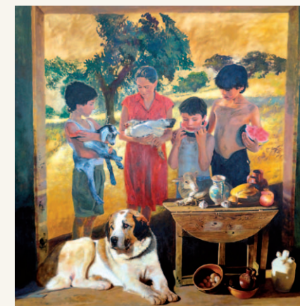
El mastín y los niños , 2009 Óleo sobre lienzo. 200 x 200 cm

Esta exposición, con el subtítulo "Los sueños de una vida", se convierte en la oportunidad de ver en su conjunto la selección de una ingente producción en la que la escultura, el dibujo y el grabado ocupan también un lugar significativo como así lo ocupan en la trayectoria de este gran artista extremeño.