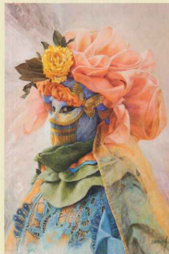
Máscara con rosa en la cabeza. 2014

Siendo un pintor de brillante trayectoria en Andalucía, sin embargo, es poco conocido en su provincia natal fuera de los círculos especializados. Con esta exposición, la Diputación de Badajoz, institución que le apoyase en sus inicios, cierra el círculo de la trayectoria pictórica