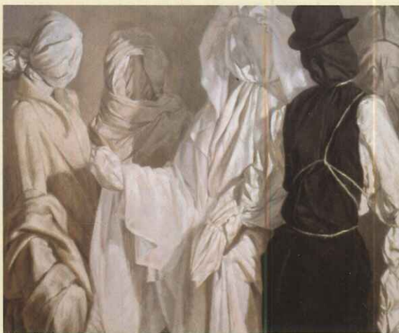
La boda del maniquí. 1981

Nacido en 1942 en el seno de una humilde familia pacense, la fatalidad hizo que, huérfano a muy temprana edad, Juan Valdés creciera junto a sus abuelos. Desde muy niño despierta en él su interés por el dibujo y la pintura siendo alumno durante su adolescencia de la Escuela de Artes y Oficios de la ciudad de Badajoz. Será con 15 años, cuando participe en el II Curso Nacional de Artes Plásticas en Madrid que marca de forma definitiva su inclinación artística.