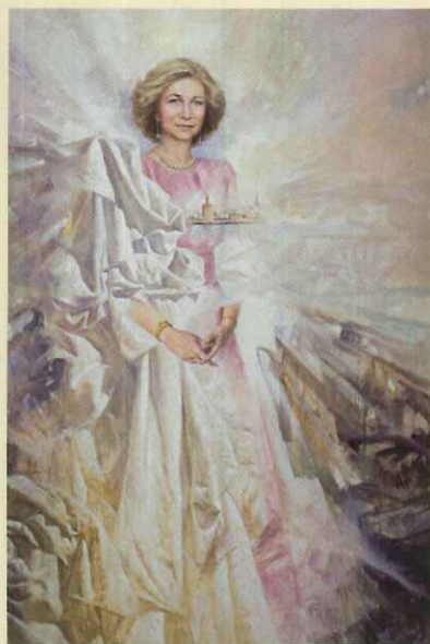
S.M la reina Doña Sofía. 1992

En estos duros primeros años realizará diversas labores para poder completar la cantidad que le permita el sustento. Trabaja en mercados, como dibujante publicitario, extra en películas rodadas en la capital andaluza e incluso formaliza el carnet que le acredita como “cantaor flamenco”, arte en el que ha logrado premios y del que hoy es un gran experto. A lo largo de su trayectoria artística el flamenco será