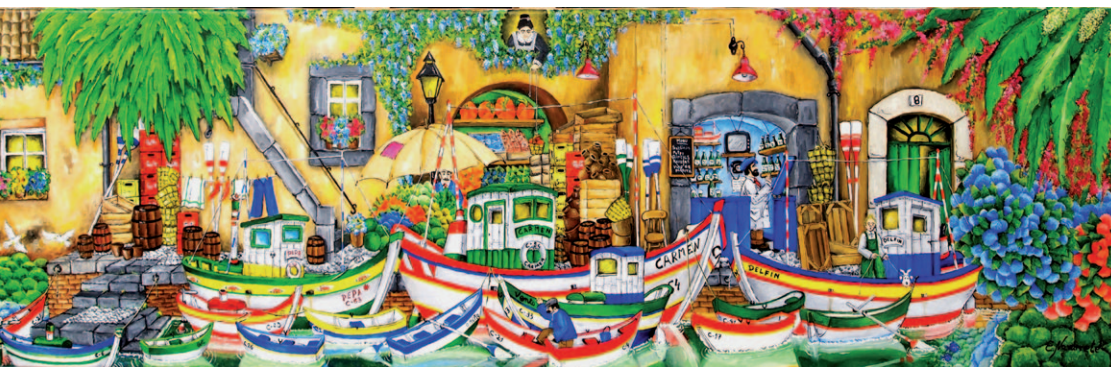
El puerto , 2013. Óleo sobre lienzo, 33 x 116 cm

emular paisajes que son totalmente reales, pasando por la incorporación de elementos fantasiosos que daban un toque muy peculiar a la estampa, hasta llegar a composiciones donde la profusión de seres imaginarios completan toda la escena hasta desbordarla.