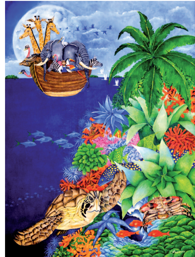
Noé y la tortuga II , 2010. Óleo sobre lienzo, 130 x 97 cm

La afición por la pintura con la libertad de no dedicarse profesionalmente a la misma le permitió mantener la frescura en sus piezas. Su enorme creatividad le permitió desarrollar diversas temáticas, desde