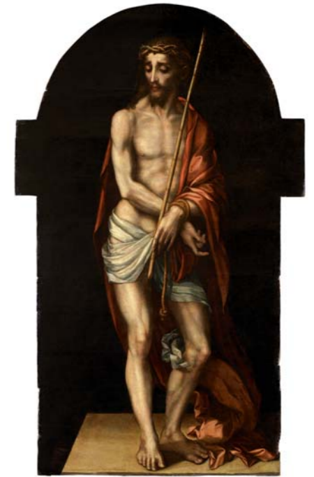
Ecce Homo o Senhor da Cana Verde , h. 1565 Óleo sobre tabla. 179,8 x 111,8 cm Museu Nacional de Arte Antiga (Lisboa).