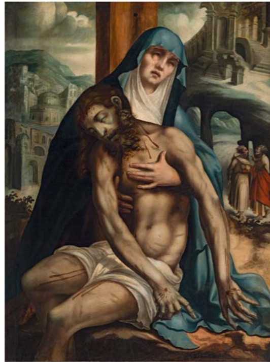
La Piedad , 1553-54 Óleo sobre tabla. 114,4 x 84,2 cm Arzobispado de Mérida-Badajoz. Museo de la Catedral de Badajoz.

Por último, en la primera planta del edificio, ponemos en valor el trabajo de investigación sobre nuestras propias colecciones. Con motivo de la organización de esta exposición, el Museo de Bellas Artes decide revisar las obras de su colección permanente relacionadas formalmente con la manera de hacer moralesca. Los resultados de ese estudio técnico se muestran hoy, acercando los estudios técnicos y los resultados obtenidos al público.