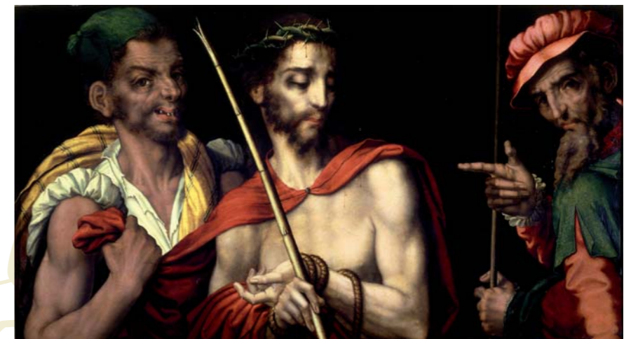
Cristo ante Pilatos o Cristo ante dos sayones , h. 1570 Óleo sobre tabla. 54 x 96 cm Real Academia de Bellas Artes de San Fernando (Madrid).