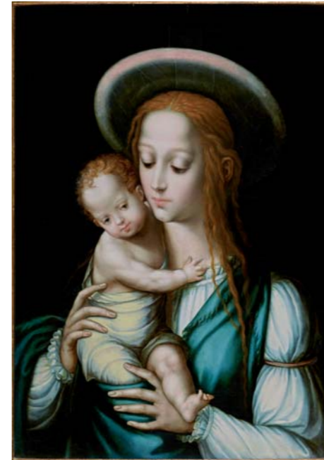
Virgen vestida de gitana con el niño , h. 1567-70 Óleo sobre tabla. 70,5 x 50 cm Colección Arango.